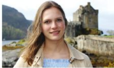
Eilean Donan Castle, Ecosse

Après la mort de sa sœur Moon, Gwennaëlle est plus que jamais déterminée à en finir avec ses ennemis. Accusée du meurtre de son père, comment pourra-t-elle prouver son innocence et triompher de son frère et ennemi ? Pour affronter Markus, un seul moyen semble possible : une alliance. Munis de leurs Pierres du Savoir, les deux Elus doivent faire face aux quatre énigmes du Diadème du Cœur Pur. Il est temps pour le peuple d'Andromeda de choisir son camp, seuls les lutins n'ont pas encore fait leur choix. Qui sera le souverain annoncé par la prophétie ?